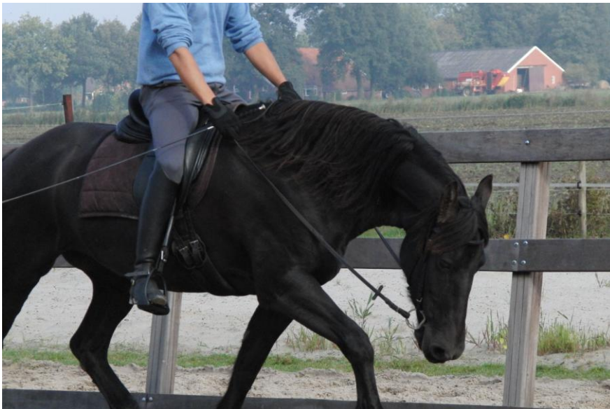
Het paard dient de hand van de ruiter te volgen.

We zien dat er over aanleuning veel te vertellen is en we laten zien dat er veel mis kan gaan. Alle genoemde problemen staan vaak niet op zichzelf. Vaak zien we combinaties van problemen en symptomen.